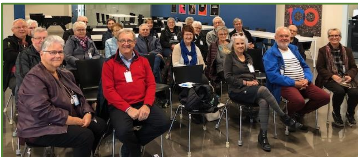
(Visite du siège mondial de Premier Tech à Rivière-du-Loup, le 19 octobre 2023)

Tél. : 418 724-1661 ou 1 800 511-3382, poste 1661