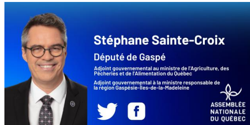
Stéphane Sainte-Croix Député de Gaspé

Adjoint gouvernemental au ministre de l'Agriculture, des Pêcheries et de l'Alimentation du Québec